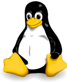
Abbildung 1: TUX, das Linux-Maskottchen {wiki}